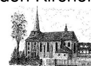
St. Laurentius Gieboldehausen