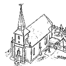
St. Matthäus Bodensee